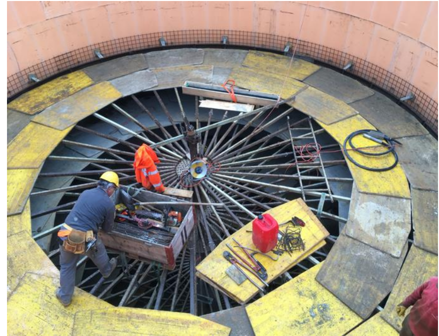
Einblick in den neuen Faulraum. Erkennbar ist die Verstrebung der inneren Schalung.

Heutzutage eher selten: der Neubau eines Faulraums! Auf der ARA Münsterlingen ist ein neuer Faulraum am Entstehen. Die ARA ist an ihre Kapazitätsgrenze gestossen. Nach dem Aus- und Umbau der mechanischen und biologischen Reinigung wird die Schlammbehandlung mit einem zweiten Faulraum ergänzt. In unseren Händen liegt die Projektleitung und Umsetzung des Neubaus. Der neue Stahlbetonbehälter - mit einem Inhalt von 600 m 3 - wurde mit einem speziellen Schalungssystem innerhalb von fünf Wochen fertiggestellt. Zurzeit wird der Faulraum mit einem Mantel aus anthrazitfarbenen Blechpaneelen geschmückt und wird im November 2020 in Betrieb gesetzt.